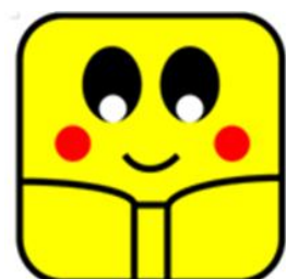
すいぼん