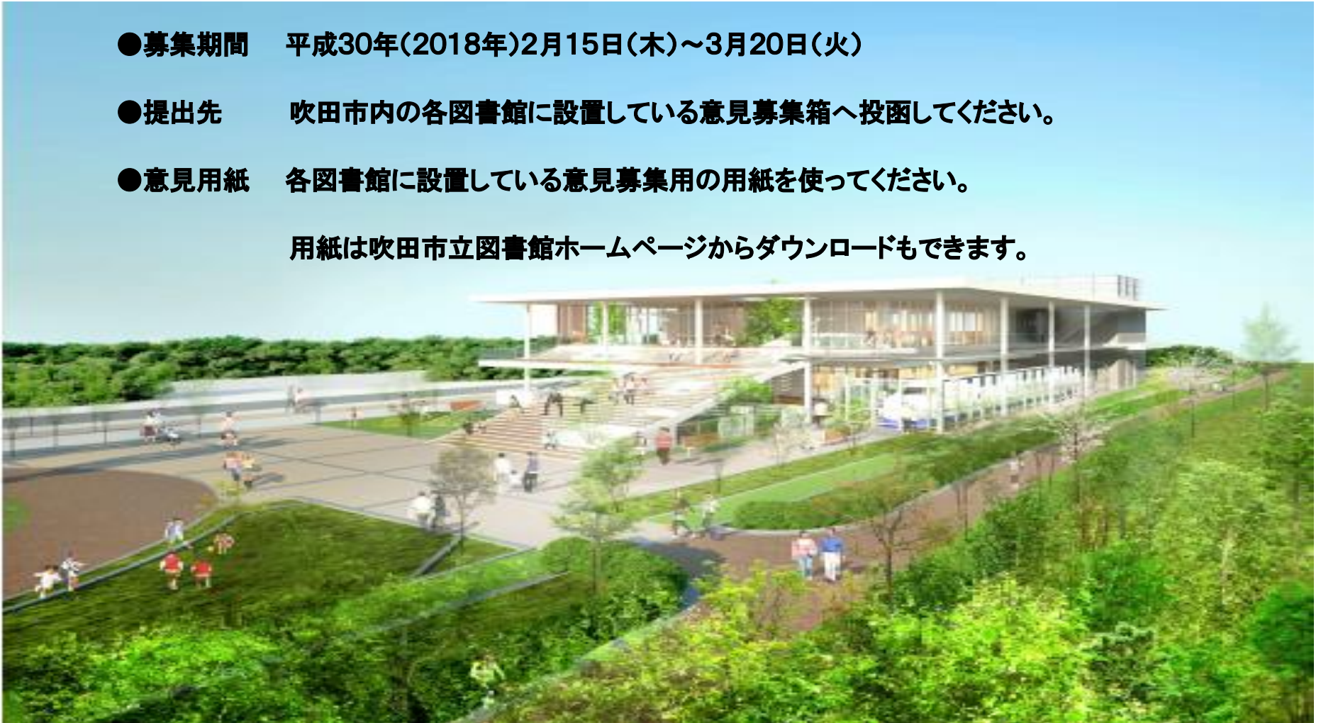
<イメージ図> ※イメージ図等は現時点のもので、設計者と本市の協議等において変更する場合があります。