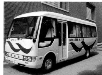
移動図書館車「あづま号」