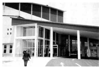
御蔵入交流館(田島町図書館)