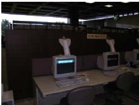
インターネットコーナー

また県立図書館ホームページ上では、リンク集として調べものに有用なサイトを紹介し、利用者の自主学習を手助けしています。