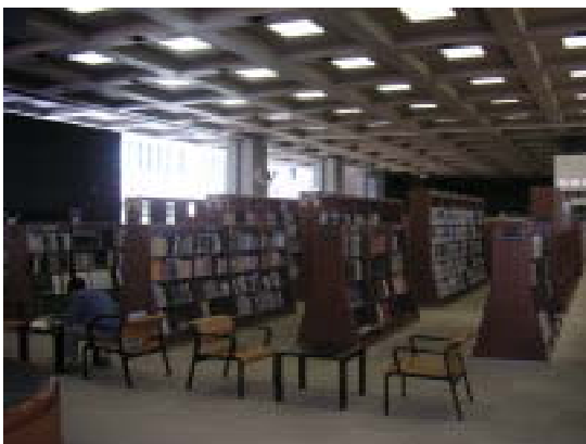
地域資料コーナー

地域資料については、福島県に関する古文書から、県ゆかりの個人の伝記、歌集、同人誌、行政や各種団体資料など、あらゆるものを収集し、保存しています。地域資料は書店では購入できないものが多く、個人・団体・機関などからの寄贈が大変重要な位置を占めています。