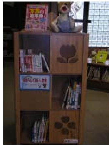
こどものへや「あたらしくはいった本コーナー」

さらに調査研究や市町村立図書館・学校図書館への協力貸出において活用を図るとともに、児童図書の保存図書館としての機能を果たします。