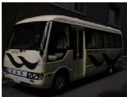
移動図書館「あづま号」