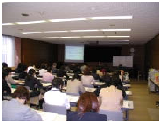
初任者研修会の様子

一人でも多くの県民の皆さんに読書に関心を持っていただけるよう公開講座を開催します。どなたでも無料でご参加いただけます。講座の日程等につきましては、県立図書館または最寄りの図書館・公民館などを通じてご案内しています。